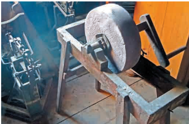
Historischer Schleifbock um 1900 mit Hallenberger Wetzstein aus Privatbesitz.

Wofür also wurden die Steine vom Hallenberg hauptsächlich gebraucht und vermarktet? Im Wesentlichen für Schleifsteine. Der Stein war feinkörnig genug, damit man schärfen und wetzen konnte. Er hat auch gut das Wasser aufgenommen, das man zum Schleifen auf den Stein geträufelt hat. Noch besser war es, wenn der Schleifstein im Wasserbad, in einer Butte unter dem Stein, genässt wurde. In nahezu jedem Bauernanwesen auf der Baar und im östlichen Schwarzwald war ein Schleifbock mit einem Wetzstein vom Hallenberg vorhanden, am besten einer, der in einem Wasserbad läuft. Und bei jedem Schmied, bei jedem Metzger, Zimmermann, Schreiner und Wagner waren diese Schleifböcke unerlässlich zum