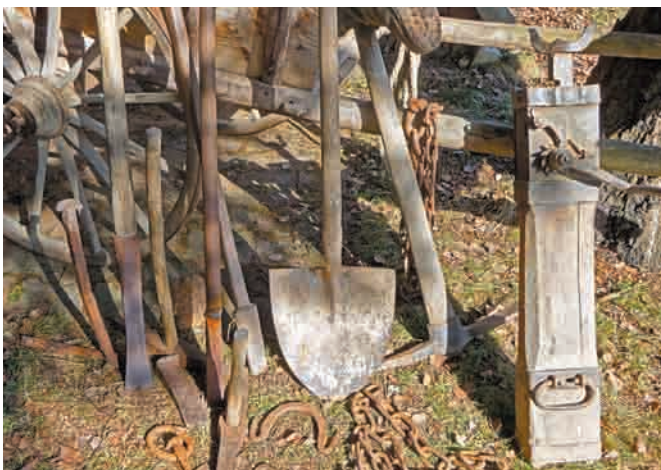
Historische Steinbruch- Gerätschaften vom Hallenberg aus Privatbesitz.

Schlegel, Hämmer, Pickel, Hebeisen, Keile, Brecheisen, Ketten, Stockwinden, Dreiböcke und Hebegeschirre haben diese bärenstarken Schmiedevirtuosen geschmiedet und gehärtet. Mit diesen bewährten, handwerklich ausgereiften Werkzeugen konnten die erfahrenen Steinhauer erfolgreich in den abhaldigen, steilen Steinbrüchen schaffen und werken.