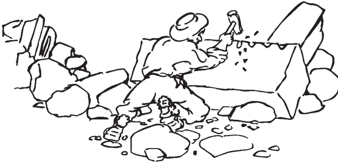
Steinhauer bei der Arbeit. Tafel an einem Steinbruchlehrpfad in Chamonix (Frankreich).