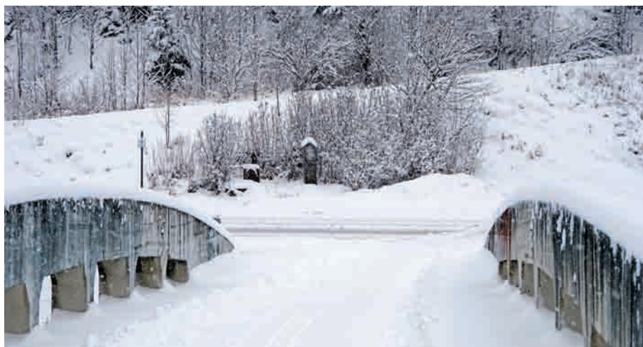
Bregtalbrücke beim Gasthaus „Schwarzer Bube“. Bildstöcke mit Gedenkstein. Die Bäume wurden vor etlichen Jahren entfernt. Foto: Hubert Mauz (Januar 2017).

Sucht man heute nach einem Heiligen, der fürs Kreuzweh „zuständig“ sein könnte, ist das nicht ganz leicht. Gelegentlich wird der Apostel Thomas für Rückenleiden genannt. Es ist aber nicht ganz eindeutig.