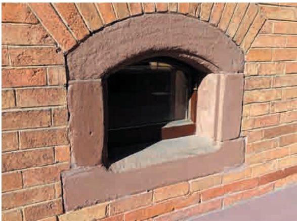
Ein Buntsandstein-Gewände an der FF-Kammer in Donaueschingen.

Weil das ein sehr beliebtes Baumaterial und ein natürlicher Werkstoff war, wurde der ganze Hallenberg nach geeigneten Schichten durchwühlt. Mindestens vier ganz große Steinbrüche sieht man heute noch deutlich und auch viele kleine Brüche und Entnahmestellen. Der Ausschuss und der Abraum, das minderwertige oder unbrauchbare Material hat man einfach die sehr steilen Halden hinuntergeworfen. Diese Schutthalden und Schuttkegel sind auch immer noch zu sehen und machen die Begehung des Hallenbergs außerhalb der Wege zu einer Knochenbrecherwanderung und zu einer fast alpinen Klettertour. Man kann leicht erahnen, wie viel Schweiß am Hallenberg vergossen wurde.