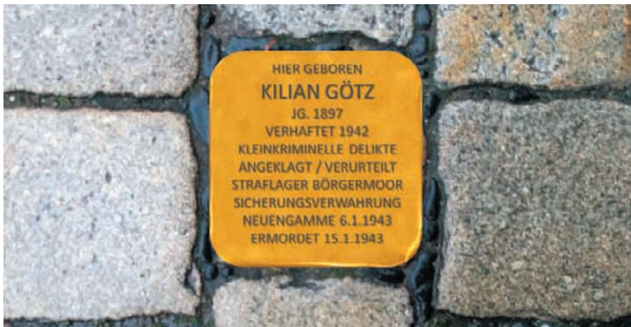
„Stolperstein“ für Kilian Götz, der am 2. Juli 2019 vor seinem Geburtshaus in Löffingen verlegt wird. Fotomontage.

„Je länger er nicht mehr zurückkommt, desto besser für die Heimat.“ Rund 100 Jahre nach diesem Verdammungsurteil kehrt die Erinnerung an Kilian Götz nach Löffingen zurück, um wach gehalten zu werden. Das sind wir ihm und letztlich auch uns schuldig. Denn gerade im Umgang mit diesem gesellschaftlichen Außenseiter und in der Erinnerung an ihn und sein Schicksal zeigt sich die Reife einer demokratischen Gesellschaft.