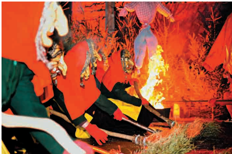
Die Hexen bitten zum Tanz. Löffinger Hexen bei der „Walpurgisnacht“. Foto: Philippe Thines (2012).

Danach tanzen die Hexen ein zweites Mal.