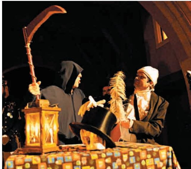
Zum Schluss geht es noch einmal hoch her. Tod und Fremder im angeregten Dialog.