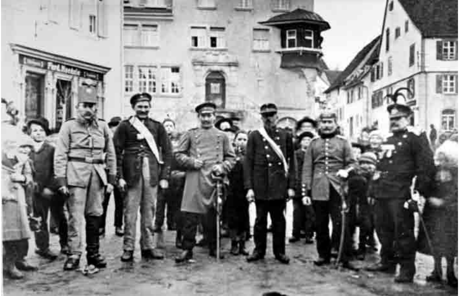
Löffinger Narrenpolizei. Aufnahme um 1910. Narrenpolizisten sind die beiden Männer links, der vierte Mann von links und der Mann ganz rechts. Dritter und fünfter von links sind zwei echte Polizisten.