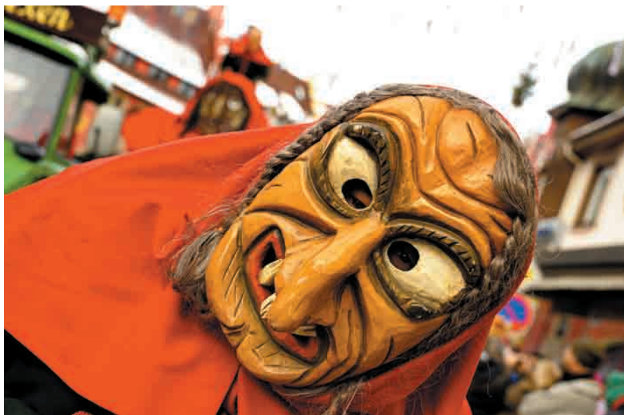
Löffinger Hexe mit selbst geschnitzter Maske.

Die Löffinger Hexe ist eine Figur mit mehrschichtiger Bedeutung. Naheliegender wäre zunächst eine Verortung in den theologischen Sinnkontext, denn die Hexe nimmt als negatives Wesen schon ganz allgemein Bezug auf den Teufel, also auf den Widersacher Christi. Es wundert daher nicht, dass entsprechende Deutungen lange Zeit vorherrschten und in der Regel eine Beziehung zwischen den Löffinger Hexen zu den örtlichen Hexenprozessen, insbesondere denen der Jahre 1635/36, hergestellt wurde. Dass die Gründung der Hexengruppe mit der Uraufführung des Fastnachtsspiels „ Walpurgisnacht “ von Leo Ratzler im Jahre 1934 zusammenfällt, müsste diese These erhärten. Dennoch sind Zweifel angebracht, denn Hexenfiguren sind überhaupt vergleichsweise neu und auch die Löff-