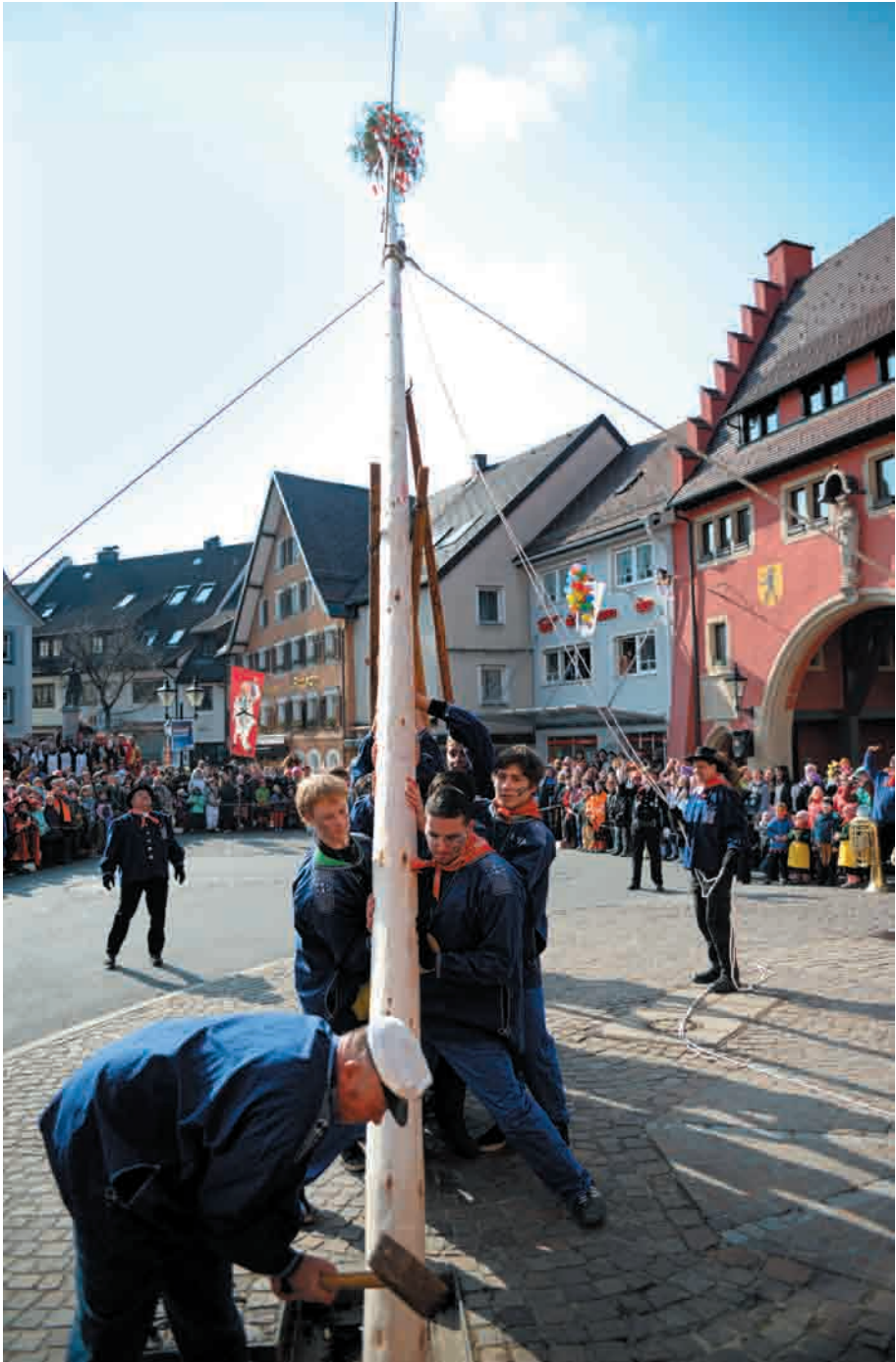
Der Narrenbaum wird aufgestellt.