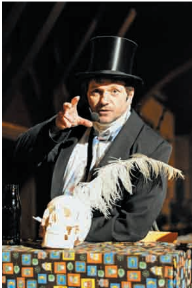
Der Fremde auf der Suche nach dem Sinn des Lebens.

Mein lieber Mann, ihr ahnet schon, dass vor euch steht ein Mann, der in langer Tradition die Zeit des Unsinns immer hüten soll, dass niemand hier, der je vergisst, dass Tage sind, die toll im Meer des Ernstes ganz sorgenfrei verlaufen. Und nun, du brauchst es nicht zu kaufen: Nimm die Laterne, sie mag dir nächstens schimmern und dich stets an dieses Freudenfest erinnern.