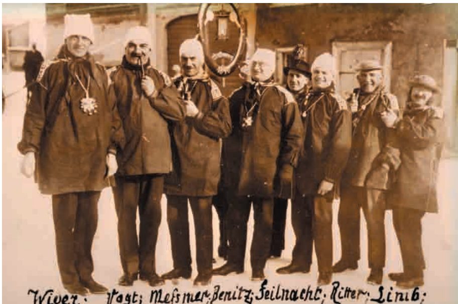
Die Laternenbrüder Löffingen 1926, bestehend aus sieben Narrenräten.

Zur Zusammensetzung und zum Selbstbild des Narrenrates: Dass der Löffinger Narrenrat zu Beginn sieben, von den 1930er Jahren an bis heute elf Mitglieder zählt, könnte durchaus einen theologischen Hintergrund haben. Schließlich sind Sieben und Elf Zahlen mit starker religiöser Symbolik. 16 Die Sieben ist eine der wichtigsten Zahlen der Religionsgeschichte überhaupt, sie ist mehrdeutig, vermittelt positive Werte. Im Fastnachtstext stellt sie allerdings die Gedankenverbindung zu den sieben Lastern oder Hauptsünden her. 17 Die Elf ist die Zahl der Überschreitung, der Anmaßung, aber zugleich auch der Unvollkommenheit. Sie hat im Gegensatz zur Sieben einen ausschließlich negativen Gehalt, 18