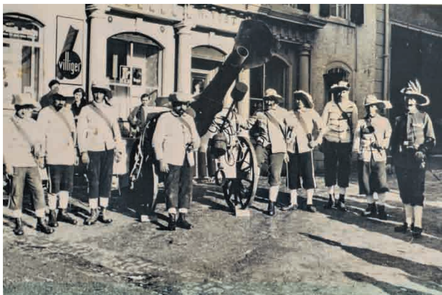
Das „ grobe Bauerngeschütz “, die sogenannte „ Brecherin von Oberhofen “ samt Bedienungsmannschaft. Aufnahme 1938.

Im dritten Akt geht es dann ums Ganze. Der Bauerngeneral ruft zum Kampf auf, die Schlacht um Löffingen entbrennt, sie tobt schwerpunktmäßig in „ Armutshofen “. Das Drehbuch will aber weder Sieger noch Verlierer und so ordnet es entgegen der Geschichte am Ende „ Versöhnung und Friedensschluss “ an.