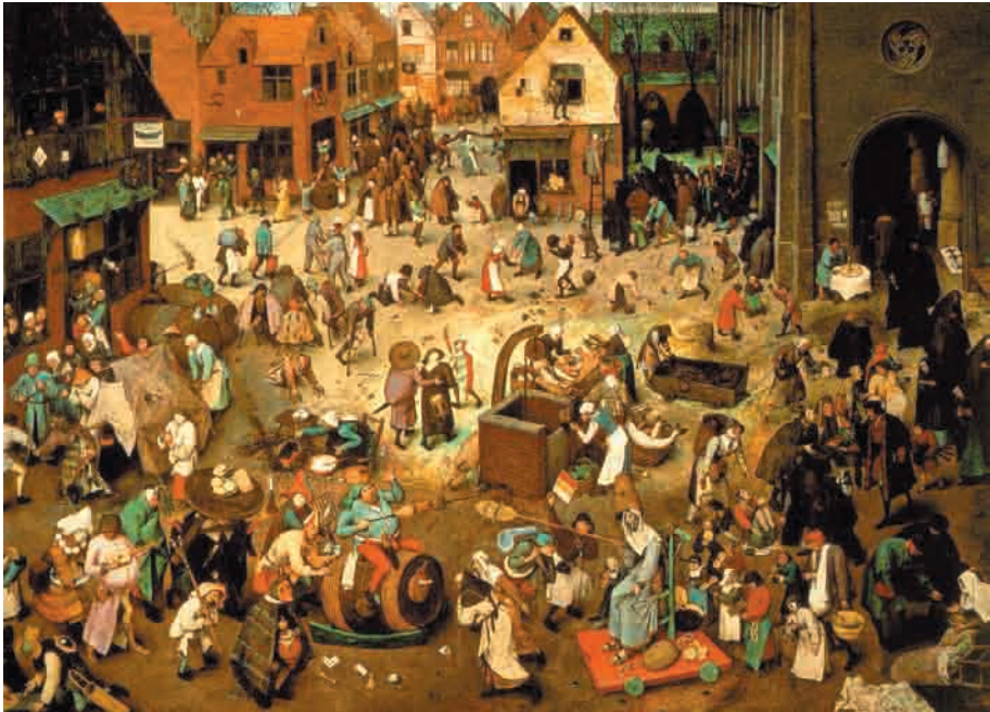
„Der Kampf zwischen Karneval und Fasten“ von Pieter Bruegel dem Älteren (um 1559). Kampf des „Prinzen Karneval“ (vorne links) gegen „Frau Fasten“ (vorne rechts). Das Bild ist gemeinfrei.

Inwieweit die Laternenbrüder der ersten Stunde von derartigen Überlegungen geführt wurden, ist nicht überliefert. Da man damals aber einen in vielen Bräuchen, Ritualhandlungen und auch liturgischen Praktiken geschulten Sinn für Licht und dessen Symbolik besessen hat, 12 ist es ohne weiteres denkbar, dass die Laternenbrüder nicht ganz ohne solche Hintergedanken zum Vereinszeichen erhoben wurde. 13 Dafür spricht auch, dass den Laternenbrüdern die Polarität, in der sich Fastnacht naturhaft bewegen muss – also die Spannung zwischen richtig und falsch, zwischen Narrheit und Weisheit, zwischen Tugend und Sünde – nicht nur bewusst war, sondern dass sie es mit kritisch-närrischem Selbstbewusstsein auch verstanden haben, die Spannung positiv aufzulösen. Das belegt der Vorspruch zur Gründungsurkunde aus dem Jahr 1889: