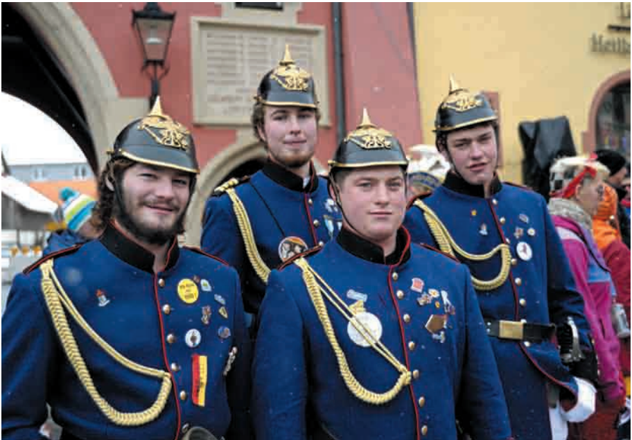
Die Löffinger Narrenpolizei im Jahr 2013, also etwa einhundert Jahre später.