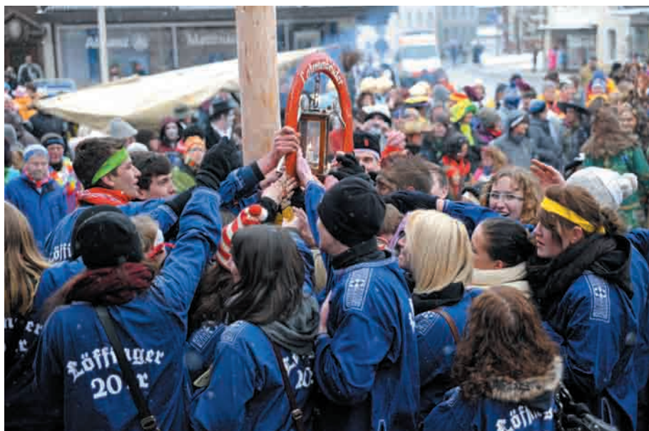
Der Schwurmoment. Die 20er werden in die Narrenfamilie aufgenommen.

In wenigen Worten ist das „Grundgesetz“ des Löffinger Narrenreiches proklamiert. Fast wie im mittelalterlichen Personenverbandsstaat stützt sich der innere Zusammenhalt der Narrengesellschaft auf die gegenseitige Treuebeziehung zwischen den Beteiligten. Beglaubigt wird die Initiation durch den physischen Kontakt mit den Insignien der Herrschaft, der Laterne, und durch die Augenzeugenschaft der Laternenbrüder. Der geschlossene Bund gilt grundsätzlich lebenslang, auch das erinnert an den mittelalterlichen Lehnseid. Was gilt in diesem neuen Reich? Alle Merkmale eines Staates (nach Georg Jellinek) sind zu finden: Gesetz ist eine Staatsgewalt (Narrenobrigkeit), gesetzt ist das Staatsgebiet (die Löffel des