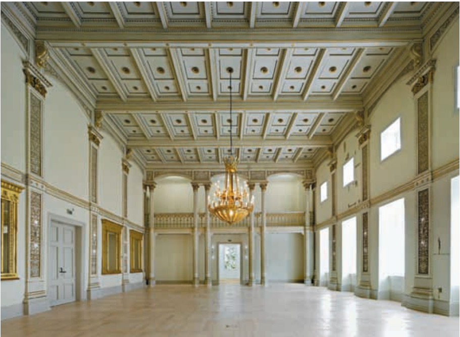
Spiegelsaal des Museumsgebäudes.