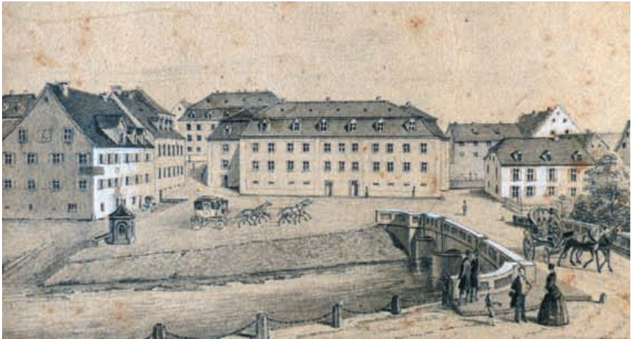
Postplatz Beamtenwohnhaus (Neubau), Zeichnung von Friedrich Jäckle für ein Tableau mit Ansichten der Stadt Donaueschingen (um 1850). Fürstlich Fürstenbergisches Archiv, Grafiksammlung.

Obwohl das Haus Fürstenberg infolge der Mediatisierung des Jahres 1806 viele angestammte Rechte eingebüßt hatte, konnte es seine dominierende Stellung in der Stadt bewahren. Es war nach wie vor weitaus größter Grundbesitzer und Arbeitgeber. Es übte die Zivil- und Strafgerichtsbarkeit in erster Instanz, die Aufsicht über Kirchen und Schulen und Stiftungen aus, hatte die Polizeigewalt und ernannte den Ortsvorstand. Das zuständige Bezirksamt in Hüfingen hieß Großherzoglich Badisches Fürstlich Fürstenbergisches Bezirksamt . Donaueschingen durfte sich Residenzstadt nennen. Die Mitarbeiter des Fürstenhauses stellten zusammen mit wenigen aufstrebenden Händlern und Bildungsbürgern unangefochten die gesellschaftliche Elite der Stadt. All dies änderte sich erst allmählich nach der 1848er Revolution, als Fürstenberg nochmals Federn lassen musste und die meisten noch verbliebenen Privilegien verlor, der Ort zum Sitz eines jetzt nur noch badischen Bezirksamtes avancierte und mehr und mehr Behörden mit Beamten aus Karlsruhe anzog.