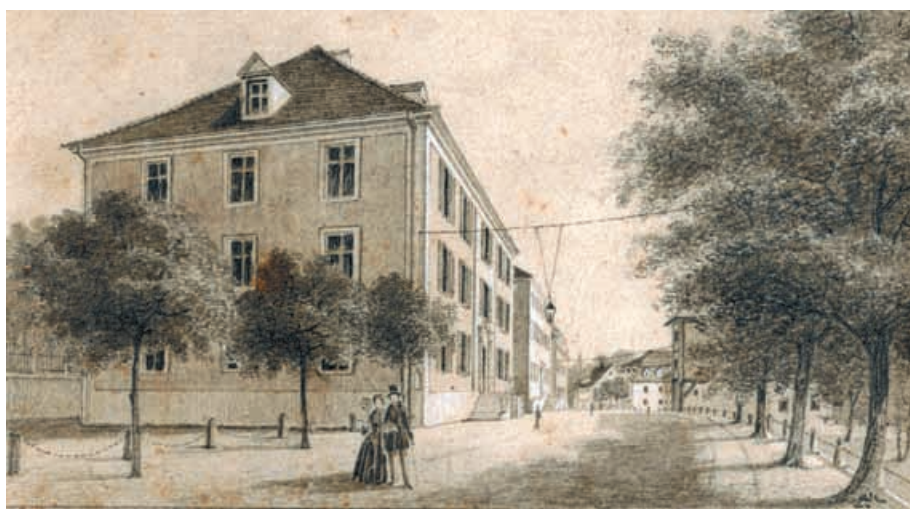
Haldenstraße mit Archiv und Regierungsgebäude, Zeichnung von Friedrich Jäckle für ein Tableau mit Ansichten der Stadt Donaueschingen (um 1850). Fürstlich Fürstenbergisches Archiv, Grafiksammlung.

Fürstlich Fürstenbergisches Archiv, Grafiksammlung.