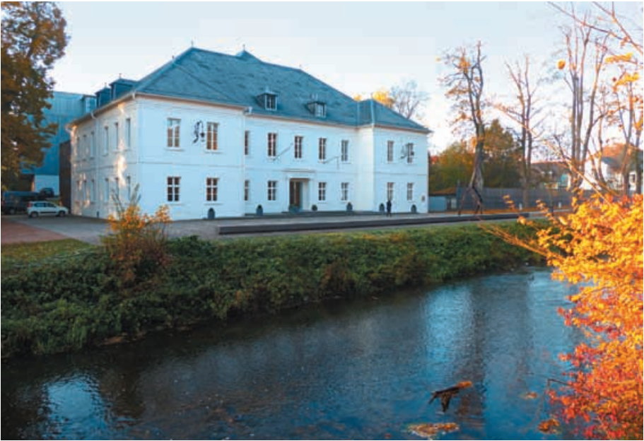
Das Museumsgebäude an der Brigach (heute Museum Art.Plus).