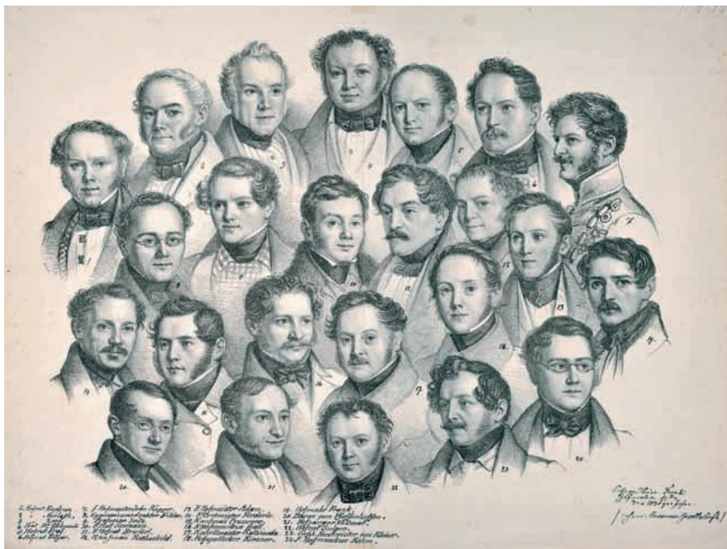
Die Mitglieder der Museumgesellschaft um 1830, Zeichnung von Heinrich Frank.

Fürstlich Fürstenbergisches Archiv, Grafiksammlung.