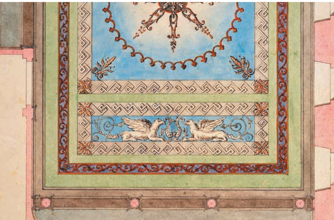
Fassade und Decke des Museumsgebäudes von 1841.