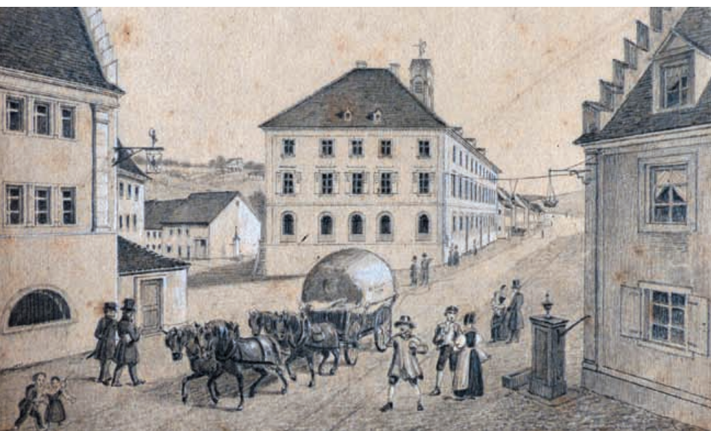
Rathausplatz, Zeichnung von Friedrich Jäckle für ein Tableau mit Ansichten der Stadt Donaueschingen (um 1850).