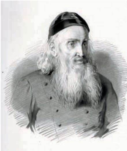
Joseph Freiherr von Laßberg (1770–1855).