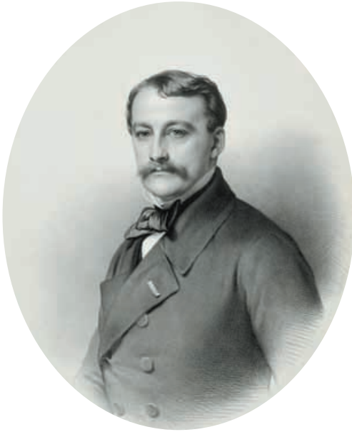
Karl Egon III. Fürst zu Fürstenberg (1856). Lithographie von Alphonse Leon Noël (1807–1884), nach Franz Xaver Winterhalter (1805–1873). Fürstlich Fürstenbergisches Archiv.