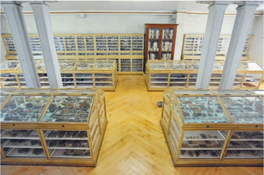
Geologische, mineralogische und paläontologische Sammlung.