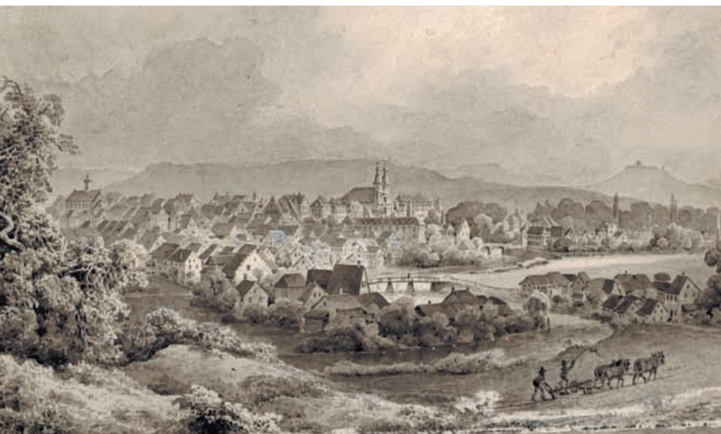
Donaueschingen um 1840, Sepiazeichnung von Konrad Corradi (1813–1878). Fürstlich Fürstenbergisches Archiv, Grafiksammlung.