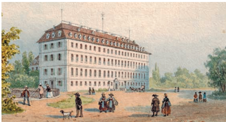
Schloss Donaueschingen, Aquarell von Louis Hoffmeister (1814–1869).

Fürstlich Fürstenbergisches Archiv, Grafiksammlung.