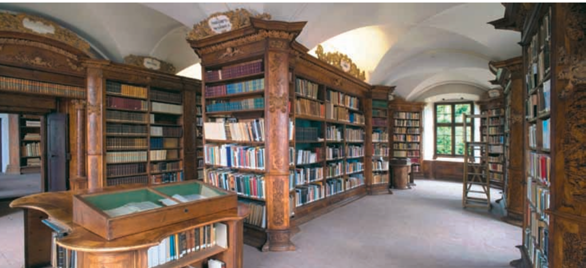
Bibliothekssaal im F. F. Archiv Donaueschingen.

Noch schlimmer sah es um die naturkundliche Sammlung aus. Sie war zum Teil im Archiv, zum Teil im Domänenkanzlei-gebäude, zum Teil im Hüfing-er Schloss aufgestellt, überall jedoch nur provisorisch.