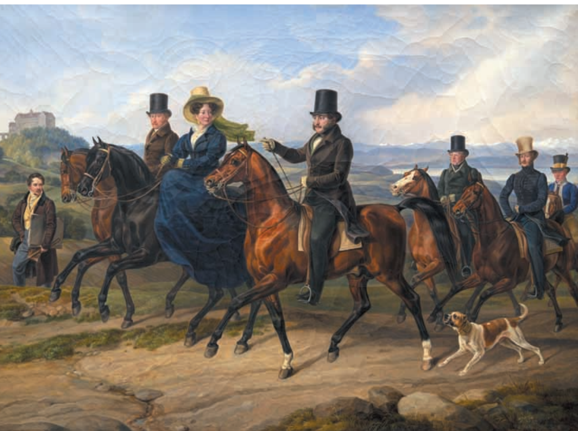
Albrecht Adam (1786–1862): Fürst Karl Egon II. und Fürstin Amalie mit Gefolge, darunter ganz links der Maler selbst (1831). Fürstlich Fürstenbergisches Schloss Heiligenberg.

Von ganz anderem Format war die badische Hofmalerin MARIE ELLENRIEDER (1791–1863). 26 Ohne feste Anstellung war sie dem Hause seit der Ver-