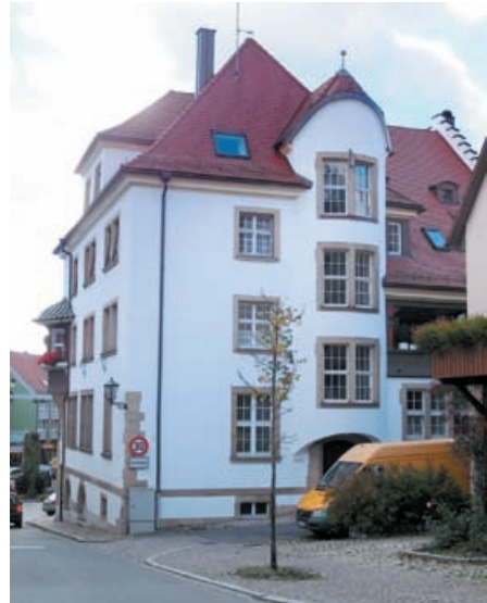
Sogenannter Stadtbau (1910/12) mit Turm-Imitat. Foto: Matthias Wider 2014

Turm hinter der Löffinger Tourist-Info. Im Innern befindet sich die Wendeltreppe zum Dachgeschoss. Foto: Matthias Wider 2014