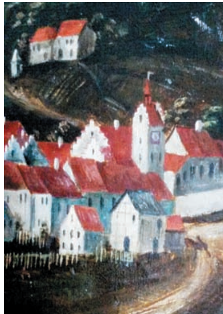
Nordlicher Teil der Stadt. Ins Auge fallt der Stadtturm mit Zinnengiebel, Sturmglocke und Turmuhr. Kopie der Stadtansicht / Vedute von Martin Menrad, 1680, Stadtmuseum Loffingen

Solche „äußeren Etter“ oder „Stadtetter“ 42 haben in mancher Kleinstadt noch lange neben der Stadtmauer her weiter existiert. Sie zeigen gewissermaßen die Ausstülpung des inneren Rechtsbezirkes über den eigentlichen Stadtraum hinaus an. Für die Stadter, auch fur die Kleinstadter, war dieser sogenannte „Friedkreis“ 43 in landwirtschaftlicher Hinsicht ein Erfordernis erster Klasse, denn hier, in unmittelbarer Stadtnaher, lagen die Garten, Bebauungsflachen, Weiden, Teiche, die im Inneren der dicht zusammengedrangten Siedlung keinen Platz mehr fanden. Den richtigen Abstand zwischen Stadtetter und Mauer hat man mancherorts auf eine anruhrend altertumliche Weise, etwa durch einen Pfeilschuss oder einen Hammerwurf, ermittelt, spater haben die Beteiligten dann offenbar rationalere Methoden gewahlt. 44