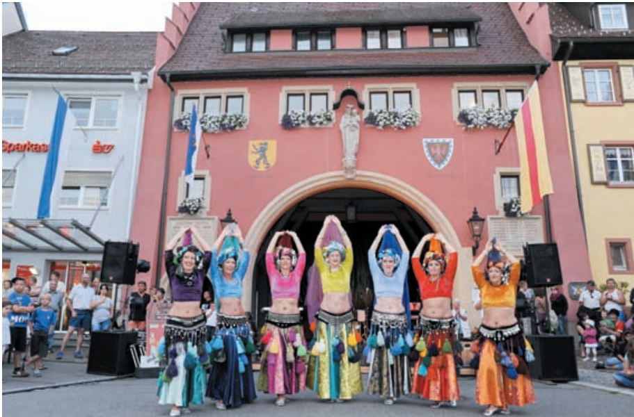
Orientalische Tanzgruppe bei der Kulturnacht 2013.

Erstens zur Tradition: Zu ihr gehört eine dezidierte Überlieferungsabsicht und ein klarer Erinnerungsauftrag; hier sei auf das Mailänder Tor verwiesen, das, wenn nicht substantiell, so doch immerhin funktional und am historisch korrekten Platz an die Geschichte weitergegeben wurde. Sollte es in Löffingen übrigens je eine Konkurrenz um den Status des wirkungsvollsten Ortes gegeben haben, dann hat sich das Tor mitsamt Vorplatz deutlich vom Verfolgerfeld abgesetzt. Was findet hier neuerdings nicht alles statt: Die Stadtmusik präsentiert seit 2005 alle zwei Jahre ihr Sommerkonzert vor der „magischen Kulisse“ 57 des Mailänder Tors. Bei den Kulturnächten kann man vor dem Bogen den Auftritt orientalischer Tänzerinnen verfolgen oder den Klängen moderner Musikkapellen lauschen. Den Nikolausmarkt hat das Stadtmarketing im Jahr 2008 aus