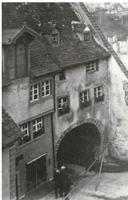
Das alte Mailänder Tor unmittelbar nach dem Stadtbrand von 1921. Stangen sollen den Einsturz des Giebels verhindern.